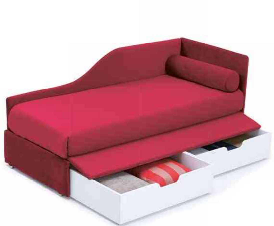
Space - S.8, 80 Con contenitore With storage containers Velluto 7, cat.C Bedlinen 8750