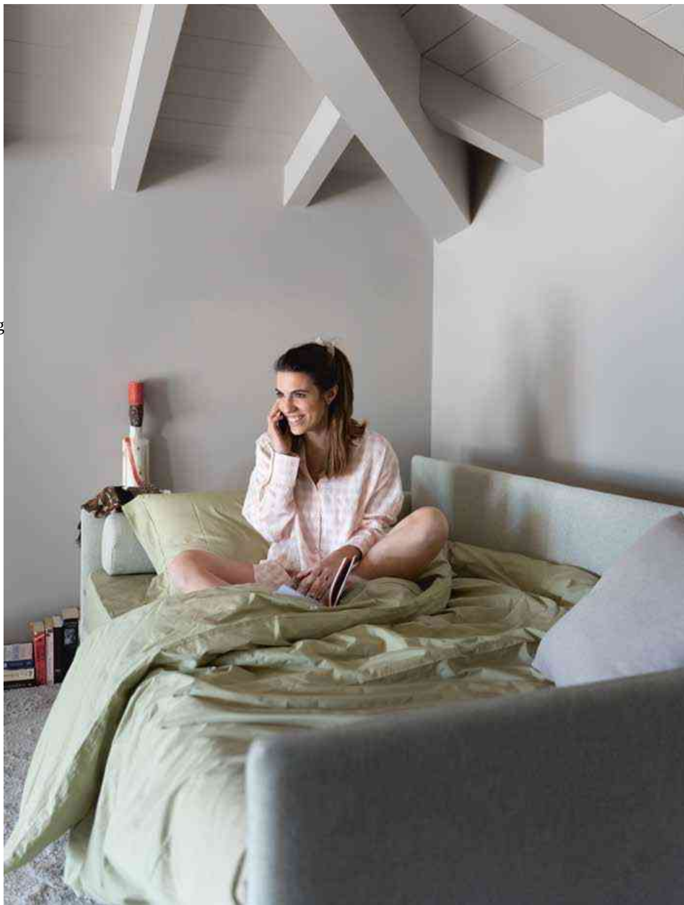
Space - S.5, 120 Con bauletto With storage Penelope 09, cat.C Bedlinen 3250

Happy awakenings In the next morning sleep without breaks and dreams without shadows