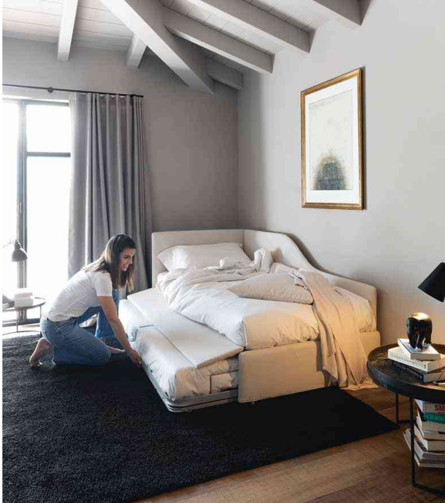
Space - S.8, 90 Con rete automatica With automatic pull-out base Dis.1437 col.20, cat.B Bedlinen 9015