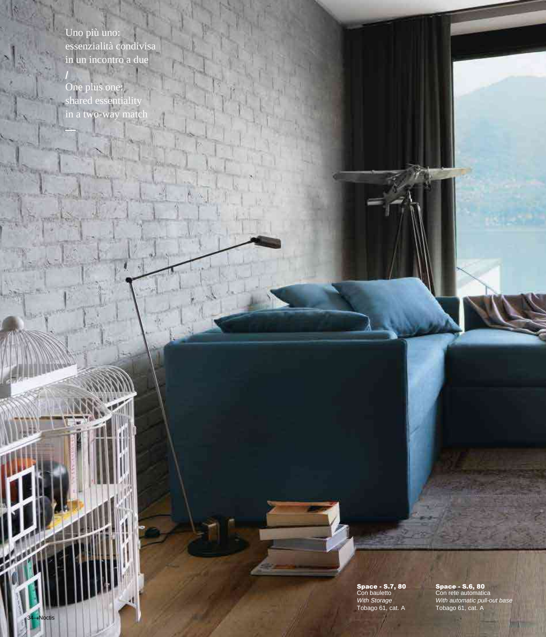
Space - S.7, 80 Con bauletto With Storage Tobago 61, cat. A

Uno più uno: essenzialità condivisa in un incontro a due / One plus one: shared essentiality in a two-way match