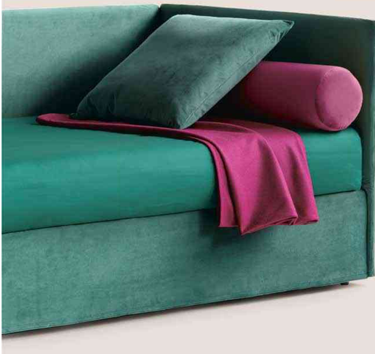
Space - S.9, 100 Con bauletto With storage Velluto 13, cat.C Bedlinen 3910