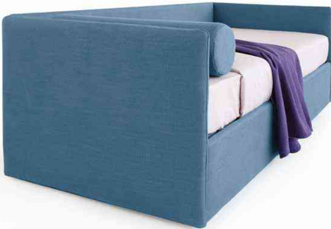
Space - S.7, 80 Con bauletto With storage Tobago 61, cat.A Bedlinen 5001